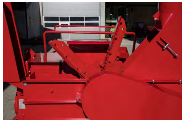
Beim direkt angebauten Hochleistungsgebläse können die Wurf-schaufel mit wenigen Handgriffen nachgestellt werden.