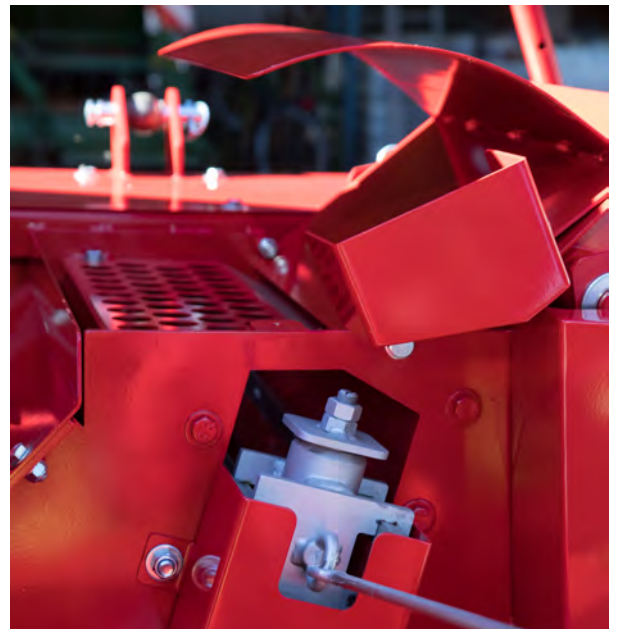
Zum Nachschärfen wird der Schleifapparat manuell über die laufende Messertrommel gezogen.

Ein weiteres Plus: das einfache Hochsetzen der Einzugs- und Vorpressewalzen für Häckselmais oder Rübenschnitzel. Der breite und besonders niedrige, hochklappbare Zuführtrog garantiert bei jedem Ladewagen oder Dosieranlage eine sichere Ablagemöglichkeit. Der Stöcker Trommelhäcksler ist damit die ideale Ergänzung für jede Siloanlage.